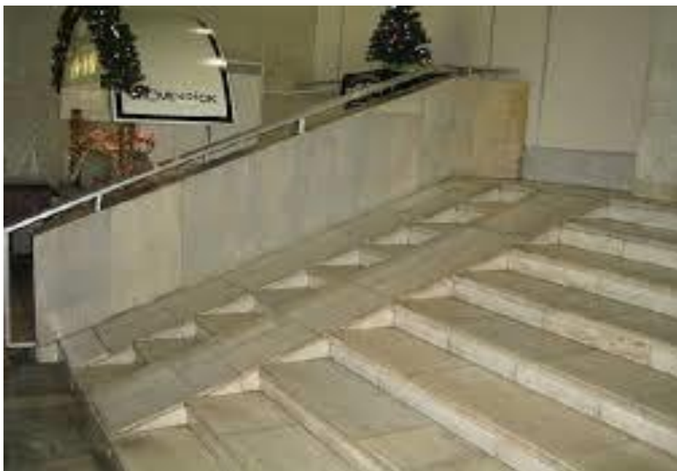
Figura 4. Rampas

A NBR de 2004 define rampa como sendo a inclinação da superfície de piso, longitudinal ao sentido de caminamento. Consideram-se rampas aquelas com declividade igual ou superior a 5%.