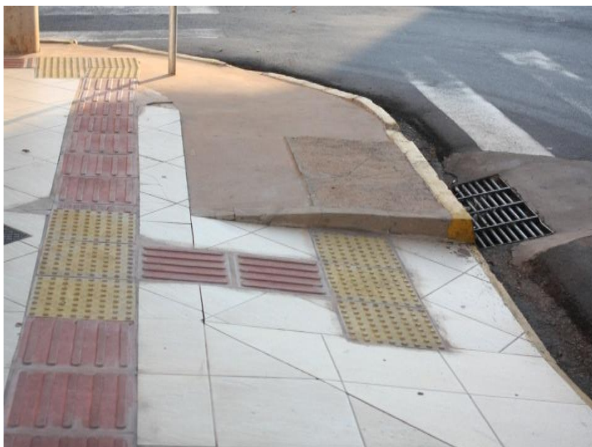
Figura 3. Calçada acessível com piso tátil