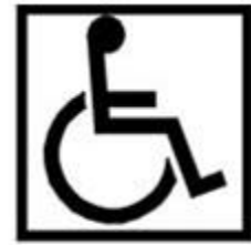
c) Preto sobre fundo branco