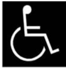
b) Branco sobre fundo preto