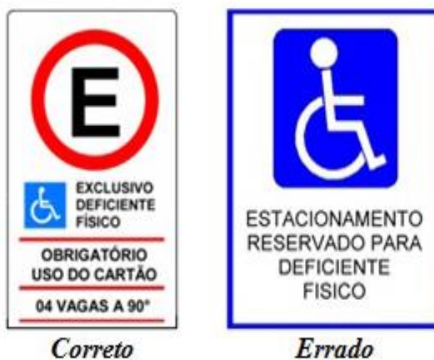
Figura 2 Sinalização vertical de regulamentação de vagas de estacionamento