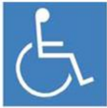
a) Branco sobre fundo azul