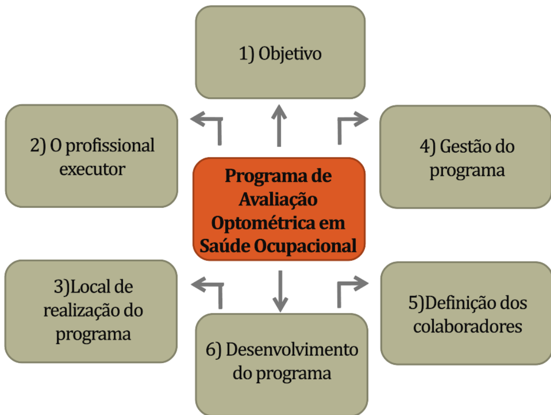
Figura 1. Fluxograma das etapas do Programa de Avaliação Optométrica em Saúde Ocupacional.

-7º Etapa – Emitir relatório dos atendimentos realizados na empresa, sinalizando as possíveis áreas mais expostas ao risco ocupacional ocular e sugerir ajustes que possam contribuir para a prevenção destes riscos.