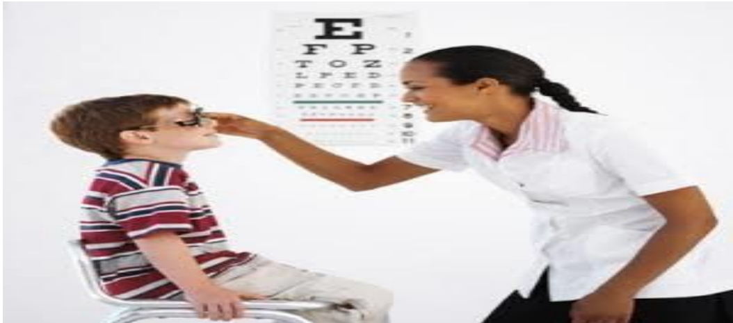
Ilustração 2 – Realização do exame de acuidade visual com a utilização da armação de prova