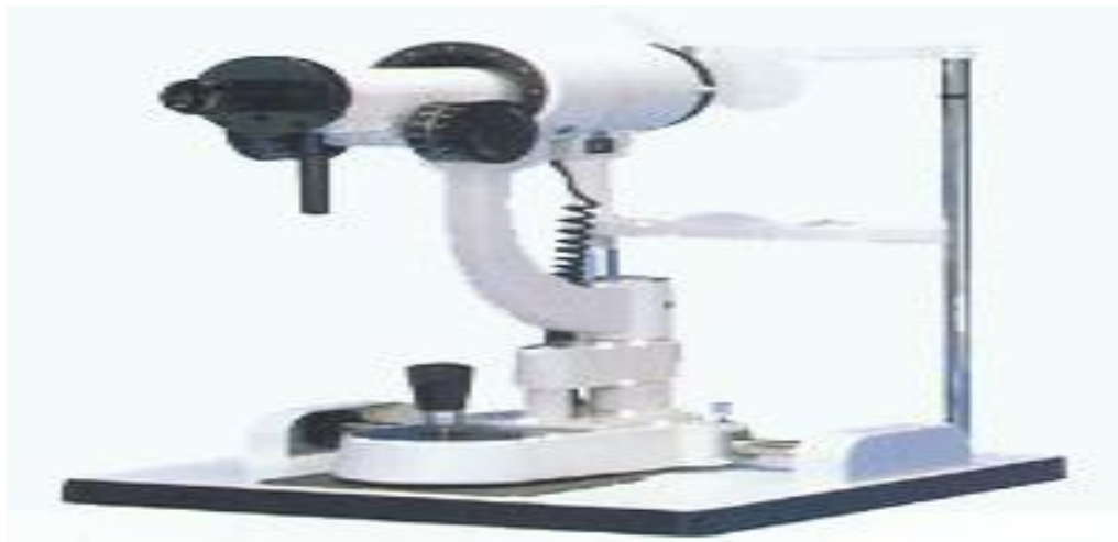
Ilustração 3 – Aparelho queratômetro utilizado por optometristas