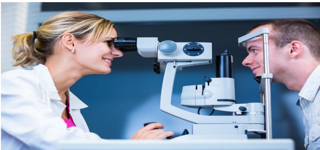
Ilustração 1 – realização do exame de biomicroscopia com utilização da lâmpada de fenda

A Optometria é a ciência da área da saúde ligada à física que trata da visão principalmente dos problemas de saúde primários, não patológicos, sobre o ponto de vista físico. O Optometrista não utiliza nenhum procedimento ou conhecimento invasivos, ele só observa e aplica técnicas de avaliação quantitativa e qualitativa do sistema de visão do paciente e é considerado preventivo. Caso o profissional encontre qualquer problema ou alteração ocular de origem patológica, ele está apto a reconhecê-lo e a encaminhar a um especialista. O papel de do Optometrista é avaliar e medir a estrutura da visão em aspectos funcionais e comportamentais, além de propor meios ópticos de correção dos defeitos encontrados no globo ocular.