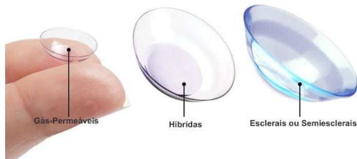
Figura 4 - Lentes de contato híbridas e esclerais

Leal e colaboradores (2007) realizaram um estudo que as lentes de contato de material híbrido, quando utilizada por portadores de ceratocone e astigmatismo miópico composto, propiciaram vantagens como o desempenho visual e conforto muito semelhantes em relação às lentes de contato rígidas gás permeáveis nos dois grupos de pacientes estudados e que praticamente não se diferiam nos resultados.