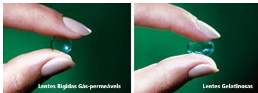
Figura 3 - Lentes rígidas gás permeável e gelatinosas

Na análise dos estudos de Phan e colaboradores (2014) as lentes RGP com desenho bitórico possuem maior vantagem pelo melhor alinhamento com a córnea promovido em situação de pós-transplante e pacientes com ceratocone elevado, quando comparadas com as lentes RGP esféricas. Uma desvantagem considerada é que pode exigir do profissional um maior tempo e maior cuidado na adaptação.