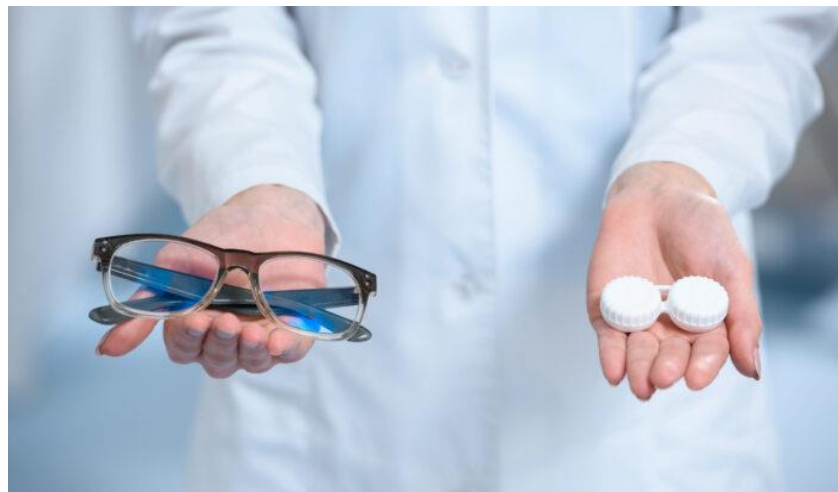
Figura 2 - Lentes de contato