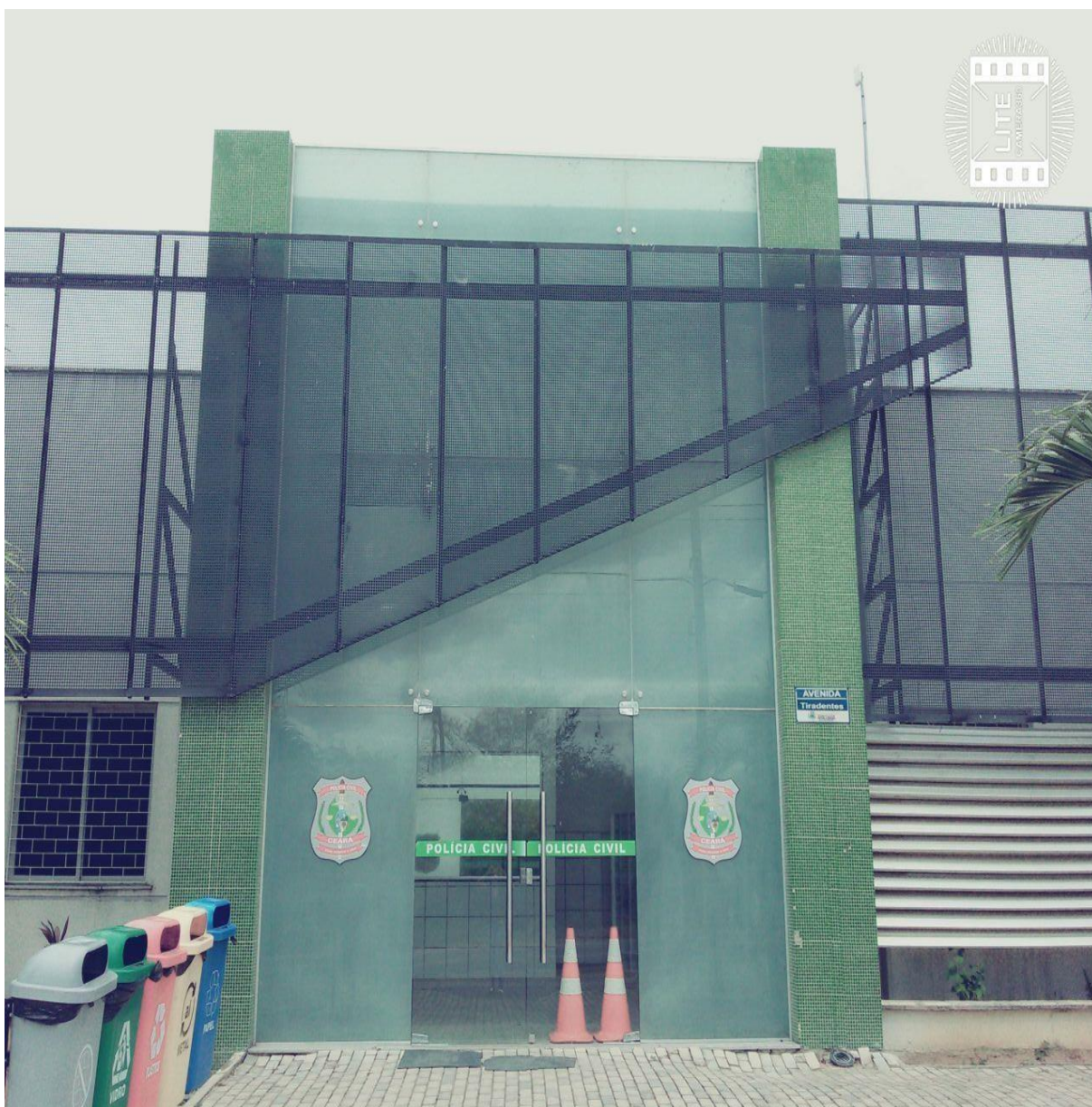
DELEGACIA MUNICIPAL DE ARACOIABA – CE ENDEREÇO: AV. TIRADENTES, Nº 1416. CENTRO