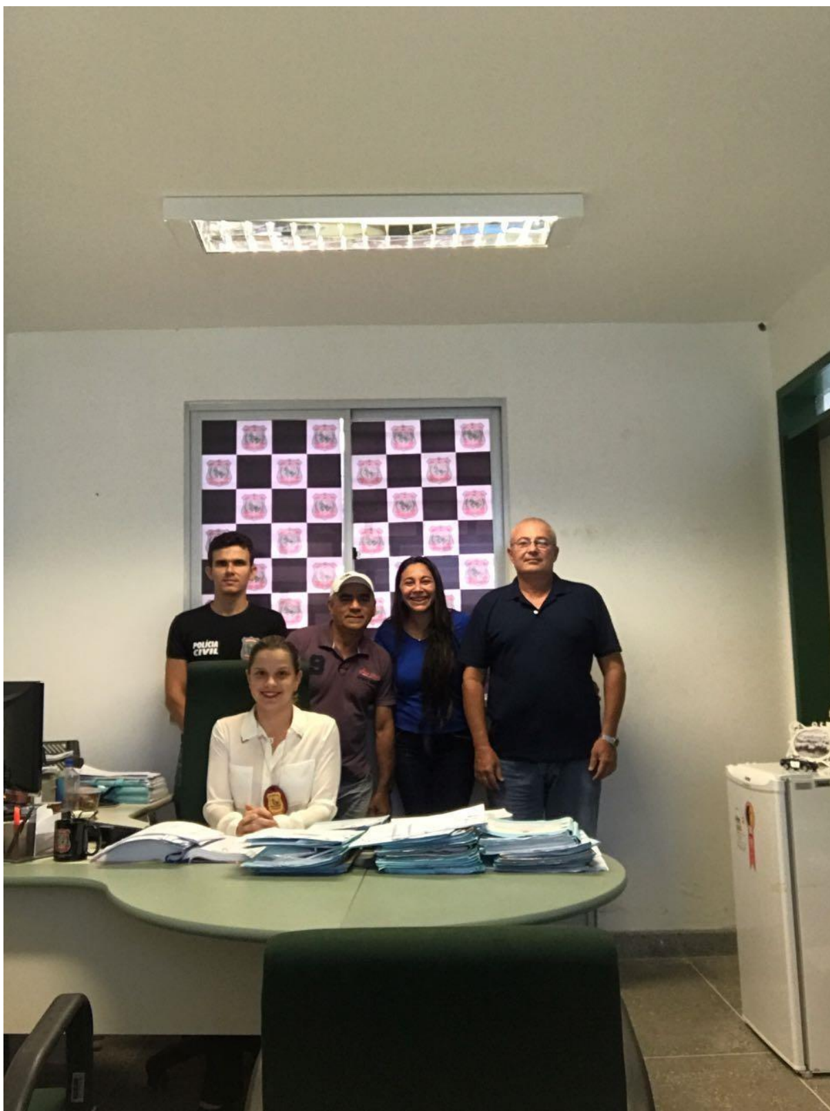
Funcionários da Delegacia de Aracoiaba - CE