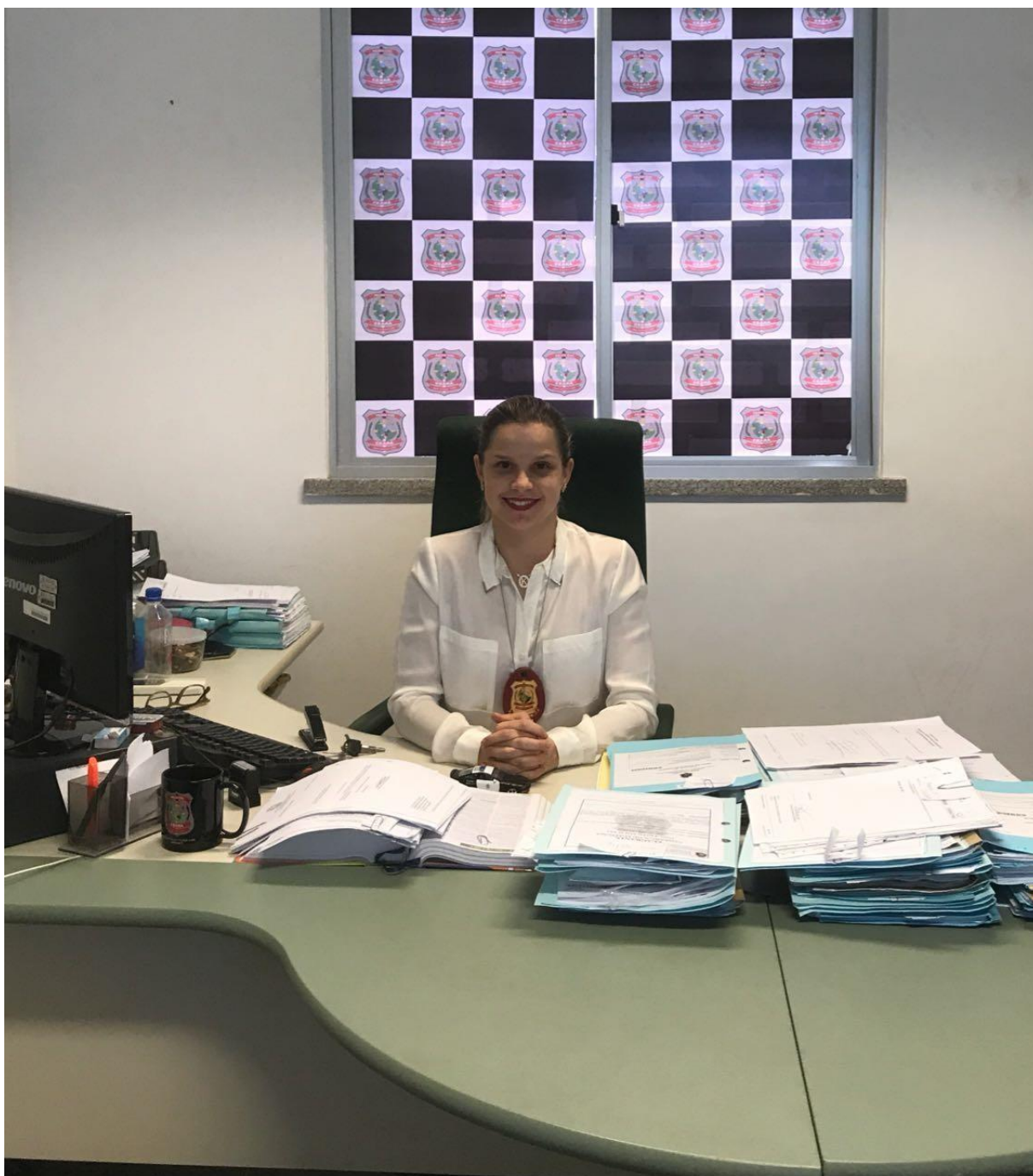
Delegada de Polícia Civil Atual Delegada de Aracoiaba – CE