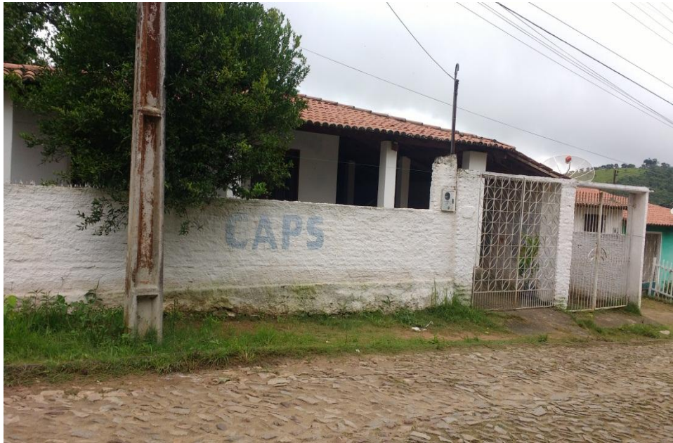
Imagem III - Fachada do Centro de Atenção Psicossocial de Mulungu- CE