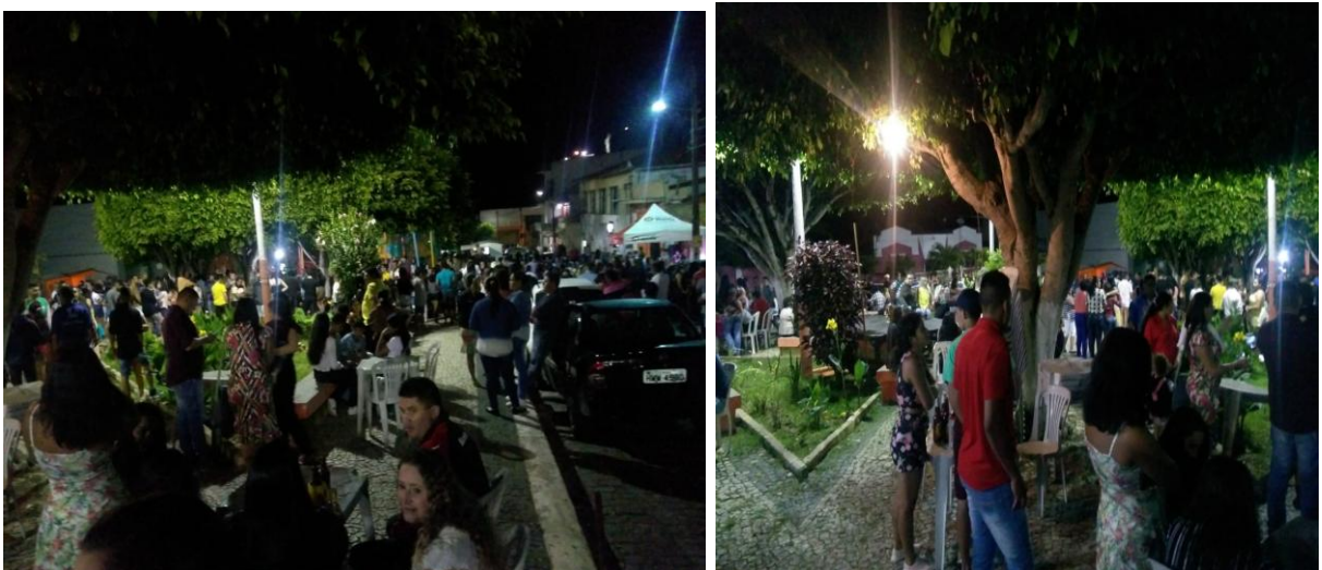
Imagem I - Foto dos Bares e Trailers do Município de Mulungu -CE

Foi observado nesse período, que para cada um desses comércios existe um público diferenciado, por exemplo, as pessoas que frequentam os bares são pessoas de no mínimo 25 anos de idade, que gostam mais de beber cachaça, agricultores, auxiliar de serviço geral e estudantes. Esses bares já ficam mais afastados da praça da matriz onde fica as churrascarias e botecos, como podemos ver através da imagem 1, abaixo: