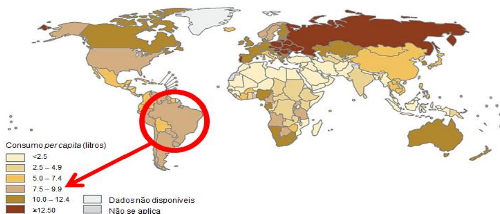
Imagem IV- Estimativa do consumo per capita de álcool de acordo com o país