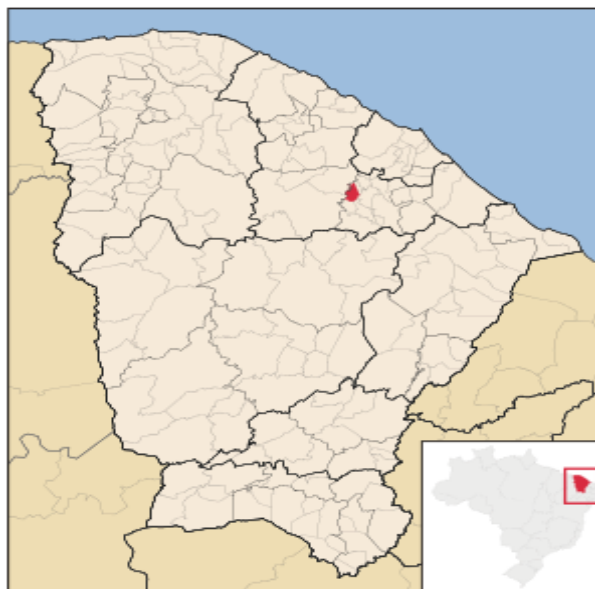
Imagem V-Mapa da cidade de Mulungu–CE

O CAPS está localizado no município de Mulungu, na Rua Padre Benedito, s/n. O município faz parte do Maciço de Baturité, e está a 120 km de Fortaleza. Conforme, mostra a imagem 5 abaixo. De acordo com o último dado divulgado, sua população é de 11.485 habitantes.