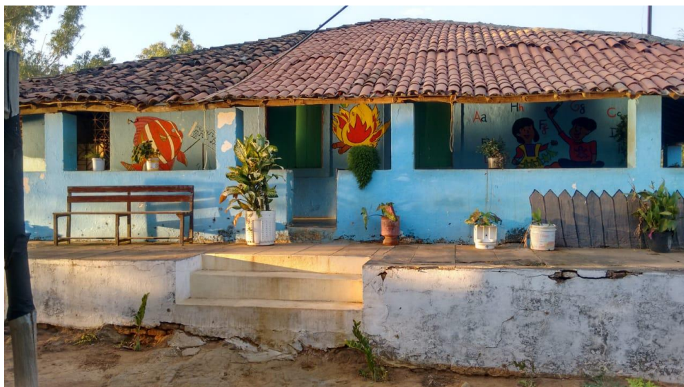
IMAGEM VIII - Casa de Cultura