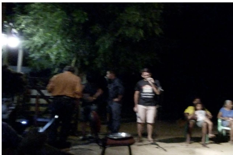
IMAGEM IX – Noite Cultural

Essa imagem retrata o acolhimento dos moradores do assentamento Todos os Santos, assim como, representam a cultura do desse, ou seja, ela traz a importância de se ter uma biblioteca e inclusão digital em um assentamento, pois os possibilita “viajar pelo mundo”. A seguir, mais uma conquista do assentamento.