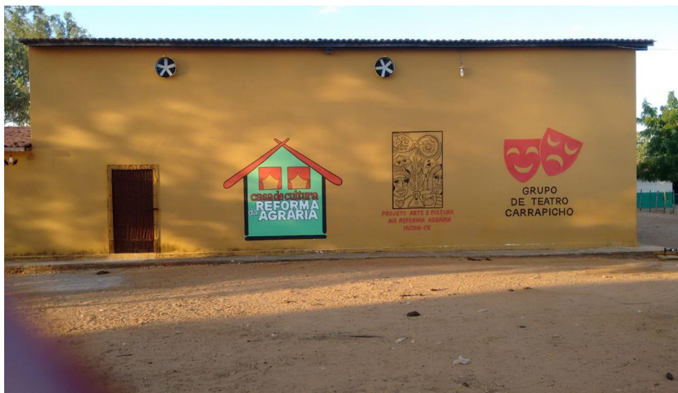
IMAGEM V - Casa de Cultura do Assentamento