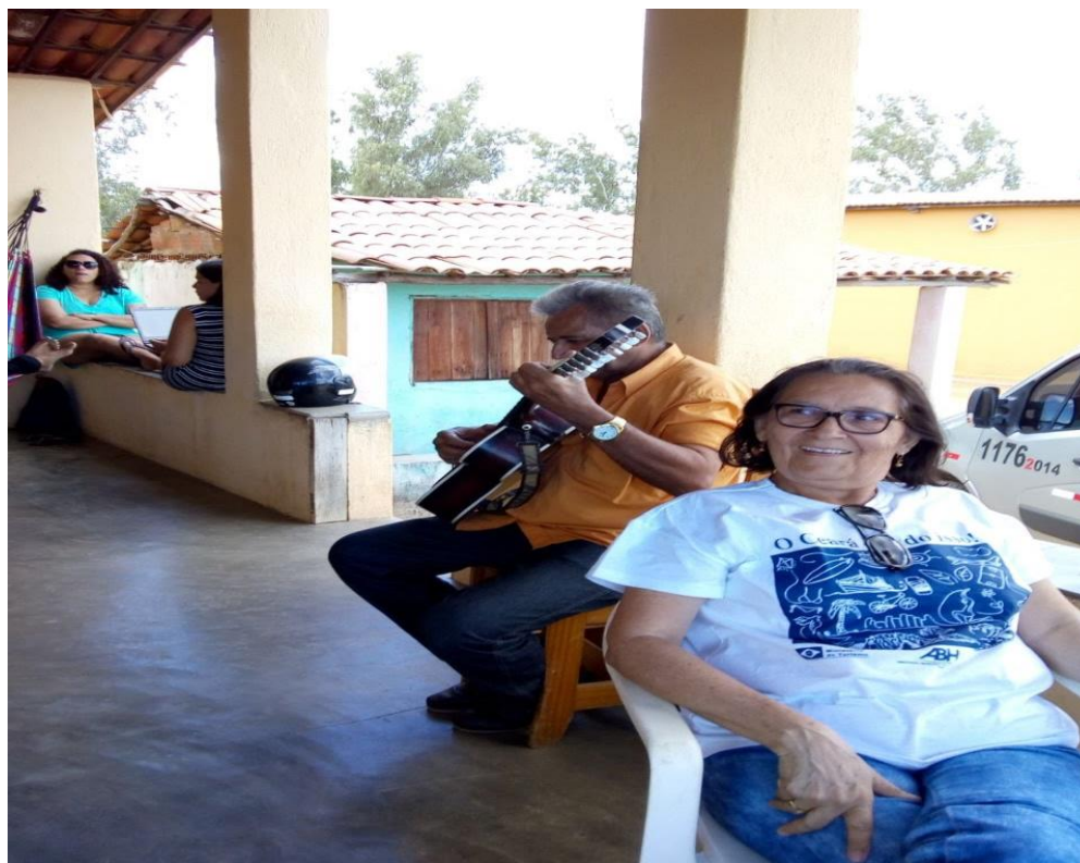
IMAGEM X – Espaço da Casa Sede

Essa imagem retrata a noite cultural, uma das conquistas do assentamento que ocorre no segundo fim de semana dos meses de junho e julho, com a participação de militantes, sanfoneiro, entre outros, animando a comunidade. A seguir mais uma imagem do assentamento.