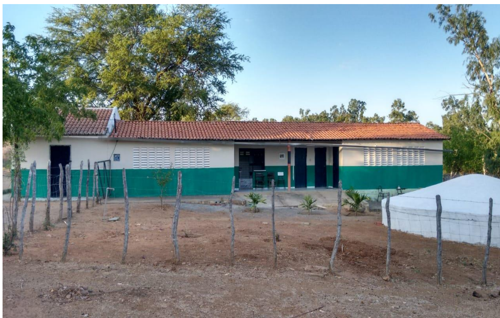
IMAGEM VII - Escola do Assentamento

Essa imagem retrata alguns integrantes do grupo do Carrapicho, no espaço do teatro não convencional, narrando uma história sobre reforma agrária para os moradores e convidados no assentamento. Porque no campo tem arte e cultura. A seguir, mais uma conquista do assentamento.