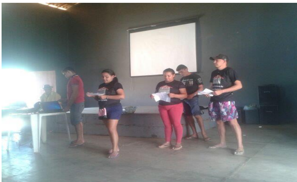
IMAGEM VI – Espaço do Teatro Não Convencional

Conforme mencionado, essa imagem retrata que a arte ultrapassa fronteiras, ou seja, foi através do grupo de teatro, conforme a imagem IV, que hoje no assentamento existe a Casa de Cultura da Reforma Agrária, contando com sala de áudio visual e teatro não convencional. A seguir, mais uma conquista do assentamento.