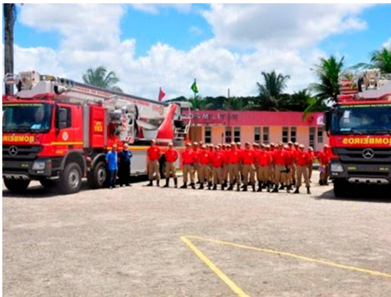
Figura 1: O bombeiro militar