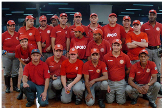
Figura 3: Brigadistas de incêndio