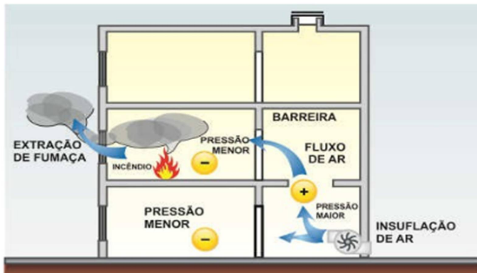
Figura 7: Extração de fumaça