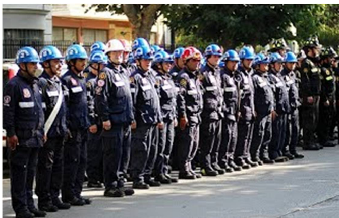
Figura 2: Bombeiros voluntários

desempenhar atividades de primeiros socorros e combate a princípios de incêndios urbanos e florestais até a chegada de uma guarnição de bombeiros militares ou SAMU ao local de ocorrência, quando necessário. A figura 2 retrata os bombeiros voluntários.