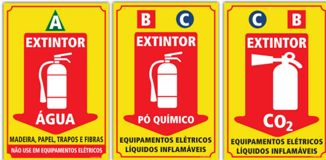
Figura 6: Extintores de incêndio portáteis.