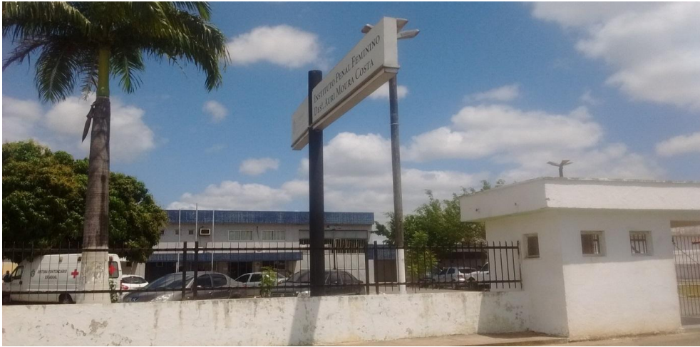
Figura 2- Unidade prisional

O presídio conta com um anexo, conforme Figura 2, onde funciona a Creche Irmã Marta local destinado ao abrigo e acompanhamento de crianças de zero a seis meses, ou até mais, assim tenham a amamentação como fonte principal de alimentação, onde ficam recolhidos junto às mães, conforme determina a Constituição Federal de 1988.