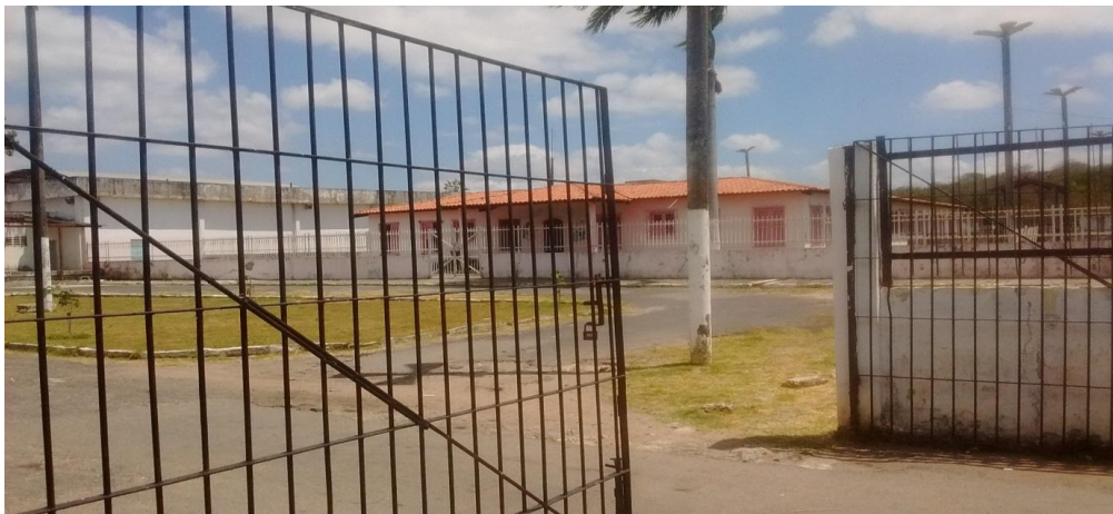
Figura 3- Creche Irmã Marta

Visando compreender a dimensão social, traçou-se um perfil dos sujeitos participantes da pesquisa, composta pelas mulheres em cumprimento de pena em regime fechado, com filho dentro da UP ou fora da cela. No entanto, os sujeitos da pesquisa seriam as internas da creche irmã Marta.