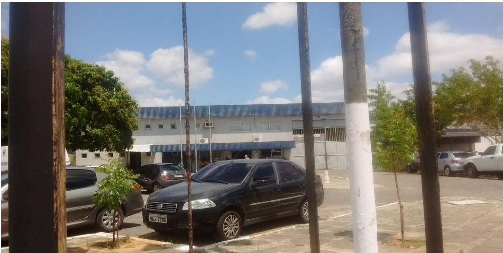
Figura 1- Instituto Penal Feminino Desembargadora Auri Moura Costa

O IPFDAMC foi inaugurado em 22 de agosto de 1974, na gestão do governador Cesar Cals de Oliveira Filho, funcionando, inicialmente, em um prédio das irmãs da congregação Bom Pastor. Em 31 de outubro de 2000, inaugurou-se o novo e atual presídio feminino, integrado ao complexo penitenciário do Aquiraz, localizado na região metropolitana de Fortaleza, ao lado do Instituto Penal Paulo Sarasate 4 e do presídio militar.