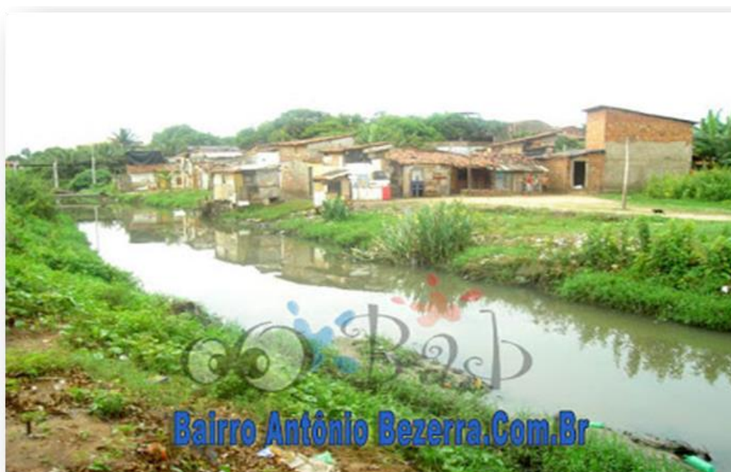
Imagem I - Início das invasões às margens do canal

Fonte: Site: < www.bairroantoniobezerra.com.br > 5