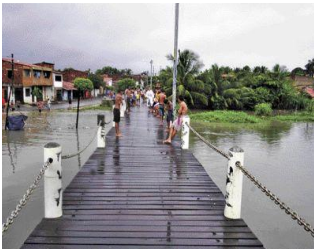
Imagem III - Ponte de madeira sobre um dos trechos do canal

Na imagem II, visualiza-se a ponte que dava acesso aos moradores do bairro Henrique Jorge ao bairro Antônio Bezerra, bairros em que o canal do rio Maranguapinho corre e, onde os posseiros formaram uma comunidade.