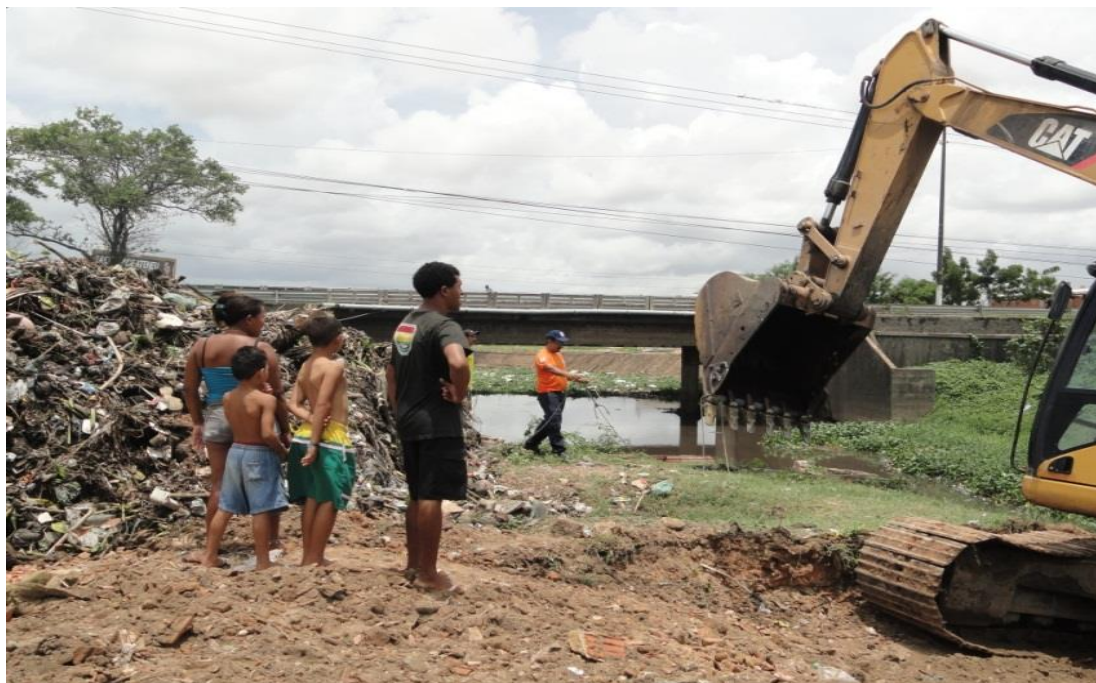
Imagem V - Limpeza anual do rio

colocam sofá velho, cadeiras, etc. No entanto, de acordo com os moradores, esse lixo é colocado também, por pessoas advindas de outros bairros vizinhos.