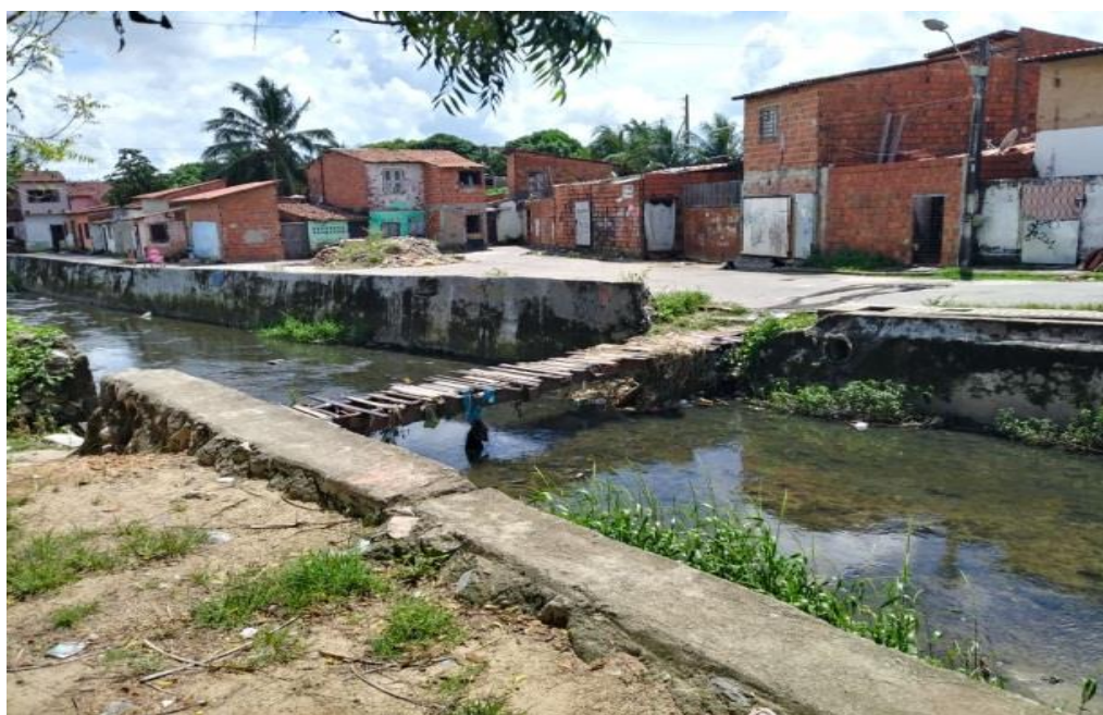
Imagem II - Casas às margens do canal (2018)