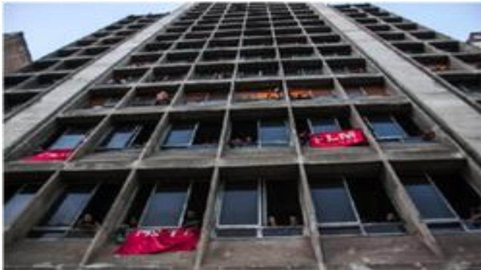
Imagem VII - Prédio público

A imagem VI, é uma foto da favela a que a urbanista se refere, em seu artigo, que localiza-se na periferia de São Paulo, e que como esta, existem várias outras por todo o nosso país. É cada vez mais comum esse retrado, como se fosse uma coisa natural. Sabe-se que as políticas de habitação não conseguem abranger toda a necessidade da população.