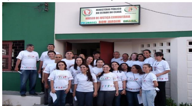
Figura 1: Equipe do Núcleo de Mediação do Bairro Bom Jardim

Até 2015 o Núcleo funcionava na Geraldo Barbosa, Nº 1095, nesse endereço também funcionava o Posto de saúde Argel Herbert, mas foi por pouco tempo, pois devido à demanda ter aumentado consideravelmente no posto, o mesmo mudou de endereço. Logo abaixo está representada a equipe que começou a trabalhar no Núcleo de Mediação do Bairro Bom Jardim, a mesma funcionou por quatro anos.