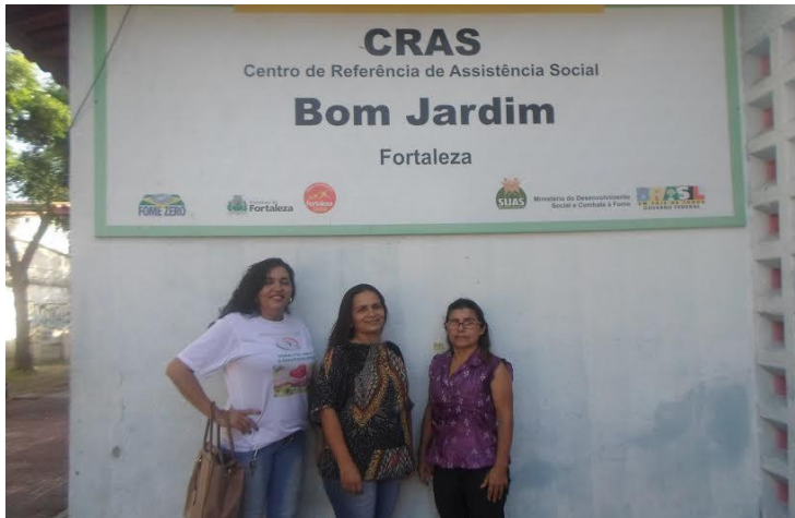
Figura 2: Centro de Referência da Assistência Social

Em 2016, o prédio teve que ser devolvido para o Posto, pois o mesmo iria ser reformado, nessa mesma ocasião o convenio com o Pronasci chegou ao fim, atualmente o Núcleo está funcionando no prédio que pertence ao CRAS do Bom Jardim, na Rua Coronel João Correia, nº 2023.