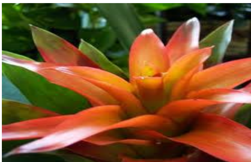
Figura 4: Flor bromélia

Para garantir o anonimato dos sujeitos entrevistados, seus nomes foram substituídos por nome de flores para compor o jardim das mulheres que frequentam a Terapia Comunitária, tudo com a concordância de todas. As entrevistas foram marcadas de acordo com a disponibilidade de cada uma tendo o cuidado de respeitar o seu tempo e o lugar que fosse de sua preferência. A figura 4 simboliza a primeira mulher a ser entrevistada.