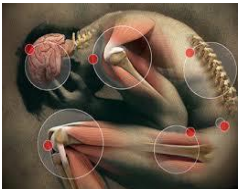
Figura 3: Quando a boca cala os órgãos fala

Já a escolha do tema tem duração de aproximadamente dez minutos, e é composta de cinco procedimentos: a fala do terapeuta cumprimentando os participantes e estimulando as pessoas a falarem da sua dor e dos seus problemas; é nesse momento que o terapeuta diz “quando o corpo cala, os órgãos falam; quando o corpo fala, os órgãos saram.” Esse ditado popular é muito utilizado na TC porque explica para o participante que se faz necessário falar dos problemas, e se não falamos o corpo adoece assim como mostra a figura 3.