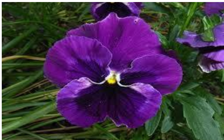
Figura 6: Flor violeta

A figura 6 representa a terceira mulher a ser entrevistada, mesmo ela sendo uma idosa e com algumas limitações ela demonstrava ter vigor como a flor violeta.