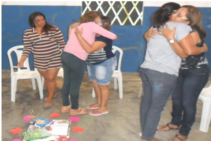
Figura 10: Roda de TC acolhimento

Segundo Barreto (2008, p.65), a TC é um espaço de escuta e desabafos, de troca de experiências da vida cotidiana, que vem contribuindo para “criar amizades, melhorar os laços afetivos e a nossa autoestima”, no sentido de criar condições para mudar um “grupo impessoal”, em um “grupo dinâmico”, amigo, solidário, onde o participante não sofra punição nem discriminação do grupo, mas que receba apoio, força, carinho e atenção, que todos os participantes se sintam acolhidos, conforme a figura 10.