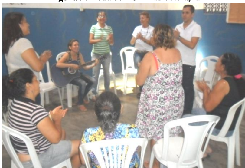
Figura 9: Roda de TC - musicoterapia

O papel da TC é criar métodos que façam com que as pessoas percebam e assumam o seu valor e passem a acreditar em si mesmos. Cada roda de TC que acontece tem como objetivo proporcionar o alívio do sofrimento, fortalecer os vínculos criados na roda e na família, e possibilitar a criação de redes solidárias. Como vemos na figura 9.