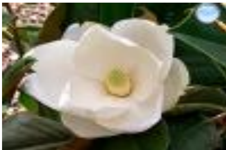
Figura 5: Flor magnólia

A figura 5 representa a segunda mulher a ser entrevistada, ela demonstrava ser simples e meiga como uma rosa.