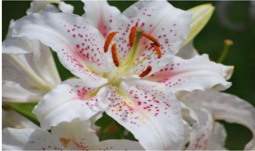
Figura 8: Flor lírio