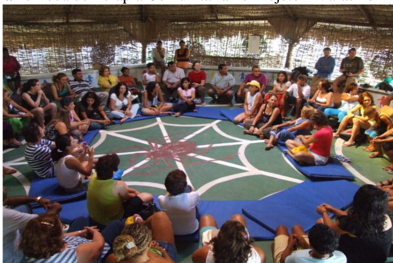
Figura 1: Roda de Terapia Comunitária no Projeto 4 Varas no Pirambu

Na TC, Barreto (2008) relata que a pedagogia de Paulo Freire é um dos alicerces em que o terapeuta e o participante da terapia, possam compartilhar experiências e aprender juntos; é uma troca de saberes, é aprender a falar e também a ouvir, é perceber a ação coletiva com ênfase na reflexão das histórias contadas durante a roda de terapia é o que observamos na figura 1.