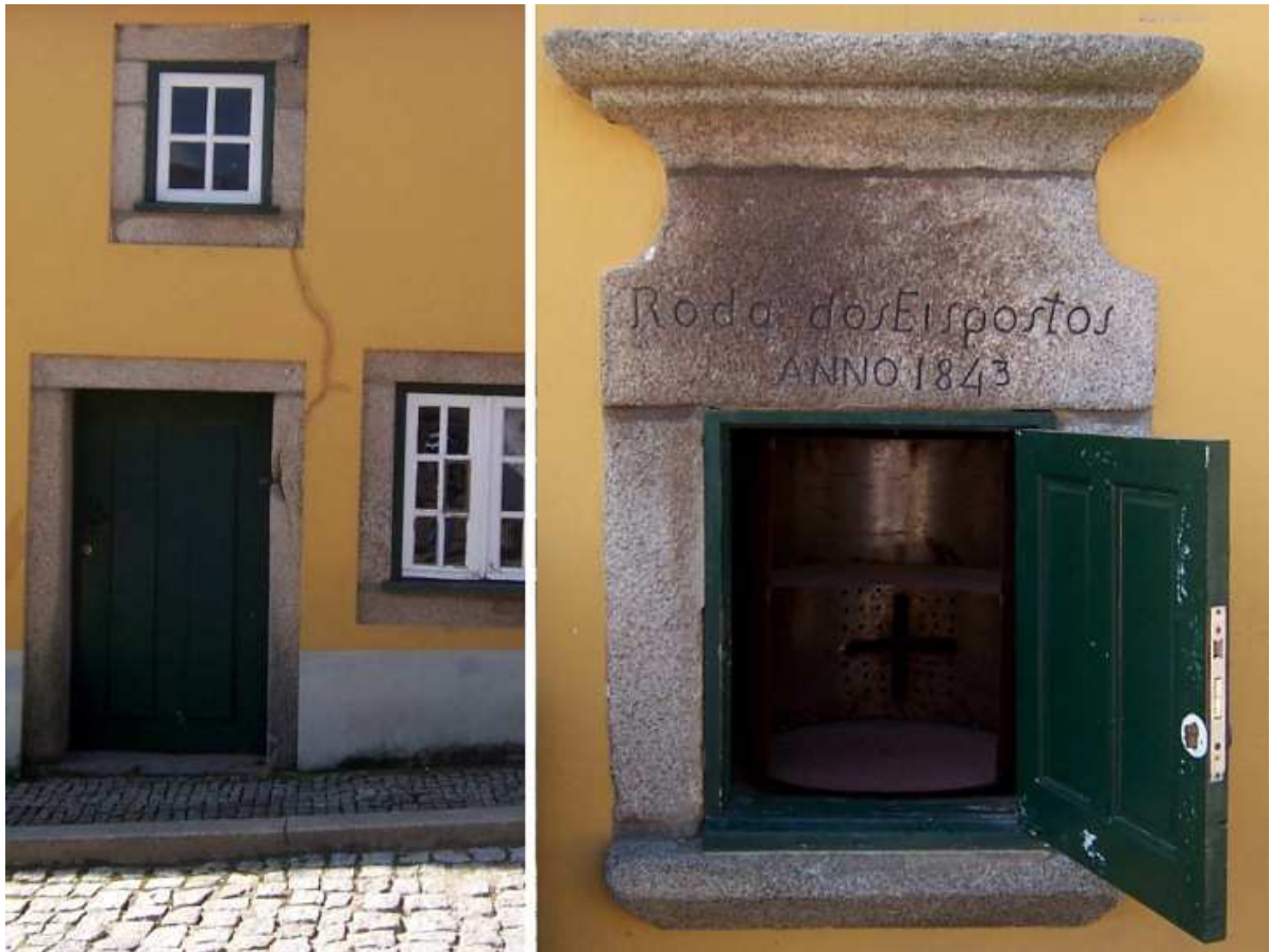
Figura 1. Roda dos Expostos 3

Vejamos a seguir, uma imagem que representa a roda dos expostos, no qual, se encontra em Portugal com o modelo do século XIX: