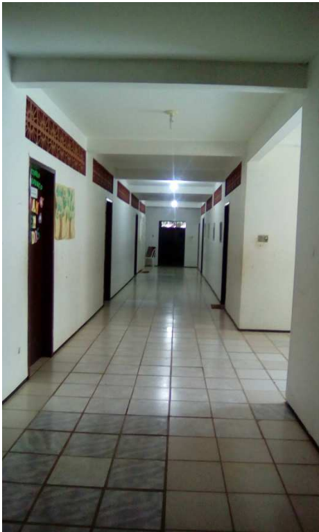
Figura 2: 9