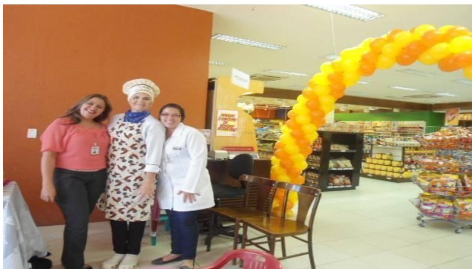
Figura 4 – Projeto Chefinho São Luiz Bauduco em Fortaleza

O projeto Chefinho São Luiz Bauduco reveste-se da dimensão lúdica, visando envolver as crianças no processo de aprendizagem e interação social. As lojas estão disponibilizando um espaço com mesas e cadeiras e decorado especialmente para os pequenos que também recebem kits com livro de receitas, toucas e aventais. Além das ações educativas, realizam-se também atividades de recreação. As inscrições são feitas nos locais com os gerentes de atendimento.