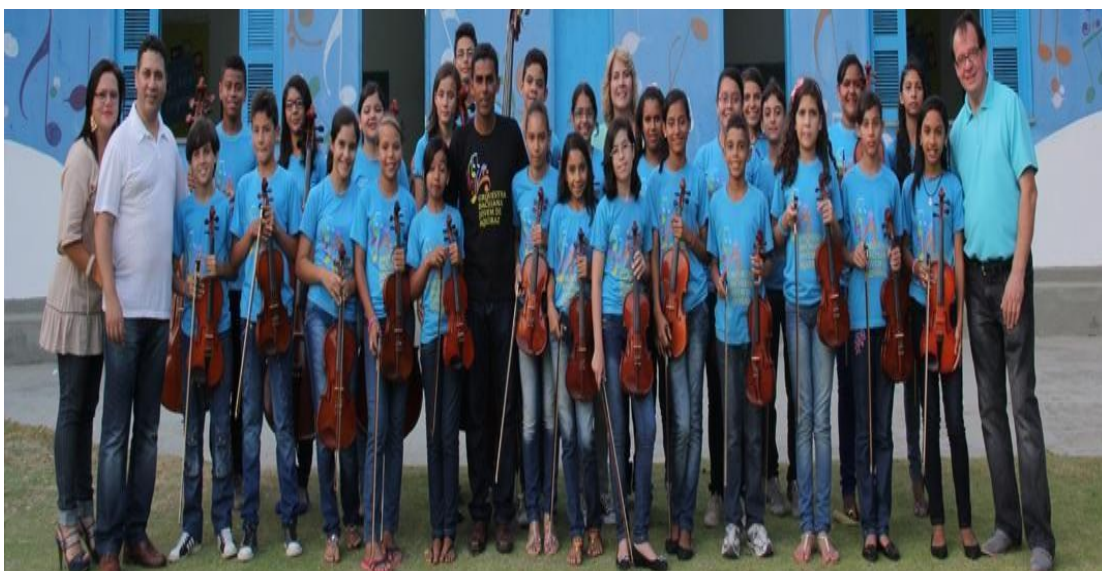
Figura 2 – Projeto Tapera em parceria com o Mercadinho São Luiz, Aquiraz

Conforme a Figura 2, o Mercadinho São Luiz promove campanhas em sua rede para doações de instrumentos musicais a serem encaminhados para o Projeto Tapera das Artes.