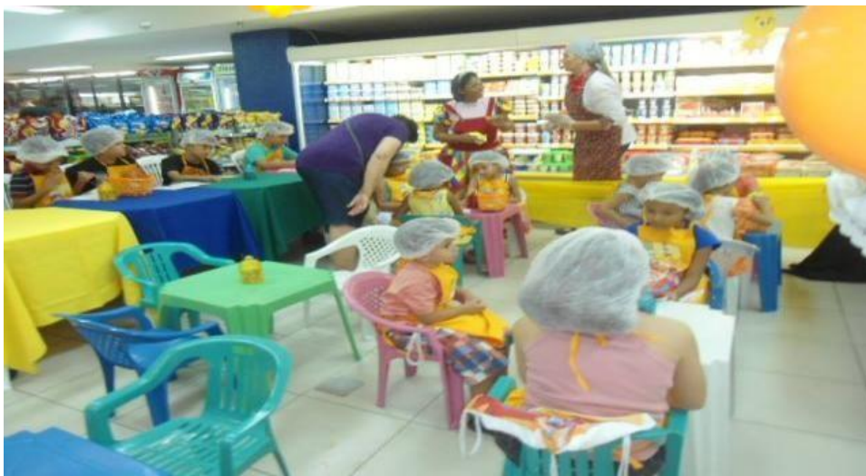
Figura 3 – Projeto Chefinho São Luiz Bauduco