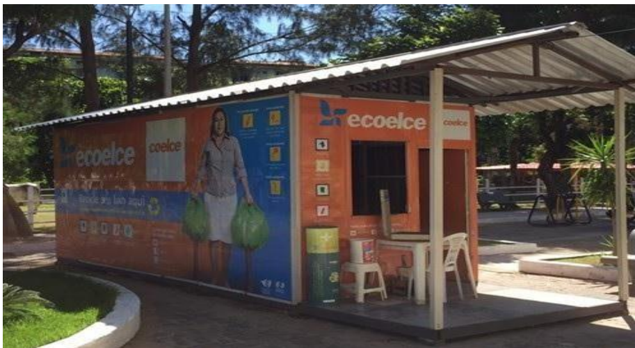
Figura 1 – Posto de coleta seletiva em parceria com a Coelce, Fortaleza

O Ecoelce tem atuação em todo o Estado do Ceará. Atualmente conta com 107 postos de coleta na Capital e no Interior do Ceará. Este projeto atua aproximadamente com 60 parceiros, englobando recicladores, associações, órgãos públicos e empresas privadas. A empresa cede o espaço para seu funcionamento, conforme a Figura 1, que demonstra um dos postos de coleta seletiva.