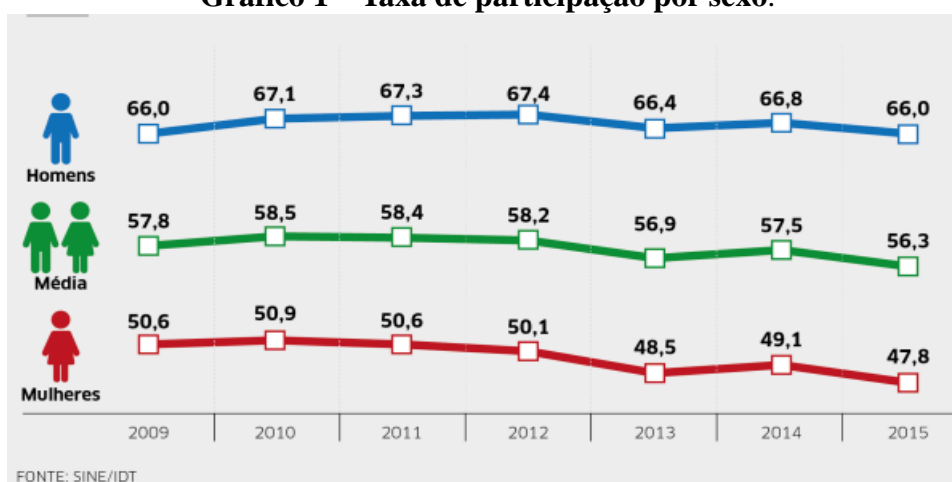
Gráfico 1 – Taxa de participação por sexo.

Desse modo, vejamos a seguir o gráfico sobre o índice da taxa de participação por sexo entre o ano de 2009 a 2015: