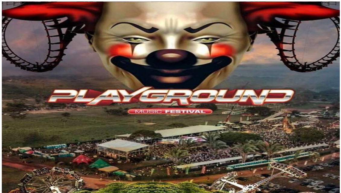
Figure 6: Playground Music Festival. Festa de música eletrônica com Djs e parque de diversões.

peças importantes como convidados Vip, fazem parceria com as grandes marcas de bebidas alcoólicas, dentre outros. Além disso, o nome das festas, ou dos estabelecimentos, apela frequentemente para uso de palavras que estão em destaque no vocabulário dessa cultura de eventos no Brasil e no mundo. São sempre palavras que possam despertar a ideia de estar curtindo algo diferenciado, para poucos.