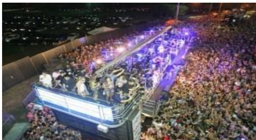
Figure 5: Fortal 2016.

Brasil e do mundo. Cidade Fortal, como costuma ser chamado o local do evento durante esse período, é dividido em dois espaços: Camarotes e o Corredor da Folia, que recebe os mais importantes artistas nacionais, tornando-se assim um dos maiores eventos indoor do País, com uma mistura musical de axé, sertanejo, forró, música eletrônica e funk para não deixar ninguém de fora.