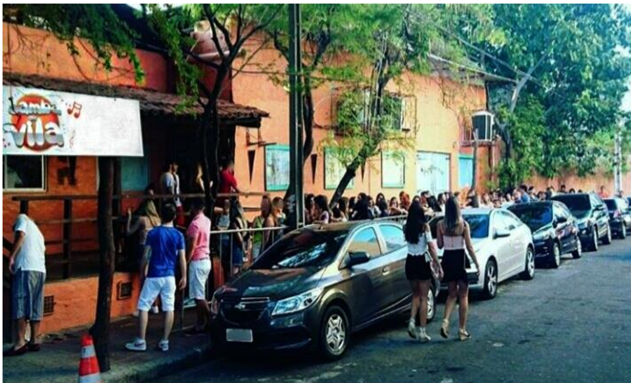
Figure 3: Bar/casa de show Samba do Vila.

Outro lugar bastante frequentado e que não poderia ficar de fora da vida noturna e badalada de Fortaleza é a Av. Beira Mar e a Praia de Iracema. É uma das vias mais importantes de Fortaleza. Ela margeia a orla urbana da capital, passando por bairros como Iracema, Meireles e Mucuripe. Ao longo da avenida estão localizados vários restaurantes, hotéis, bares e edifícios residenciais. Já na Praia de Iracema que boa parte da vida noturna de Fortaleza acontece. O Réveillon da cidade acontece aqui, no Aterro de Iracema, onde mais de 1 milhão de cearenses e turistas se reúnem para vibrar a chegada do ano novo. O local também é utilizado para festas da prefeitura e do governo do estado.