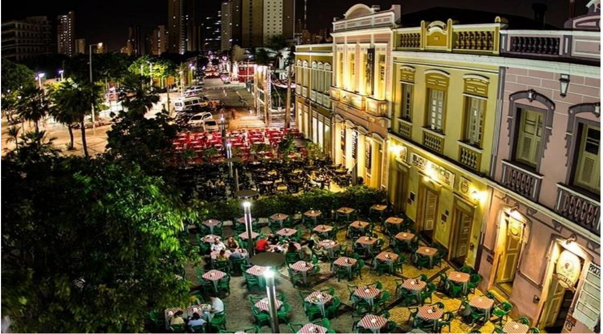
Figure 1: Bares Dragão Do mar.

Como sempre cearense é bem criativo e não gosta de perder a piada. Nada melhor do que usar essa criatividade para criar um nome de um estabelecimento, destacando-se dos demais bares disponíveis da cidade. Estou falando do bar chá da Égua. Funciona de terça-feira a sábado, das 18h às 4h, no Bairro Montese. Boteco bonito e animado, com música ao vivo, petiscos deliciosos, pizza e o delicioso Filé de tilápia na crosta de aveia com molhos especiais, carro chefe da casa.