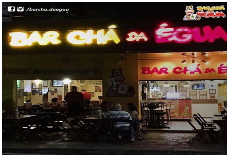
Figure 2: Bar Chá da Égua.

Para quem procura um ambiente bacana, com gente bonita, música boa, vai encontrar no Samba do Vila, na Varjota. Funciona todos os sábados, a partir das 15h, com caipirinha e cerveja liberada até as 17h. Samba, axé, e sertanejo agitam a casa que fica aberta até as 22h. Geralmente as pessoas chegam cedo para aproveitar ao máximo a consumação de bebidas alcoólicas liberada. O ingresso custa em torno de R$ 30,00, mas, nas redes sociais há um sorteio de cortesia para as mulheres.