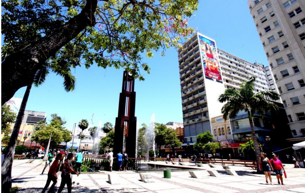
Figura 1. Praça do Ferreira