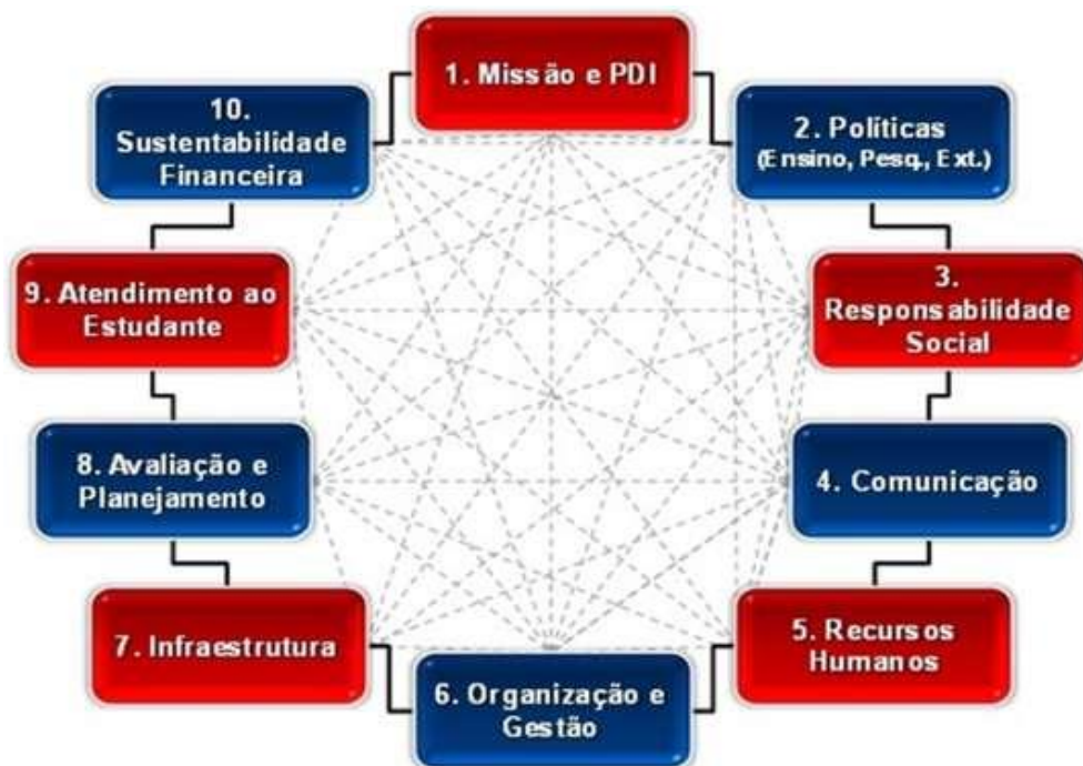
FIGURA 1 - As dimensões da IES conforme o SINAES (Lei nº 10.861, de 14/04/2004).